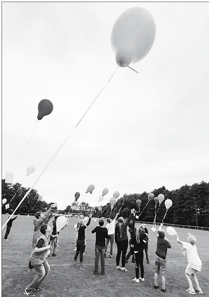
Wünsche für die Zukunft