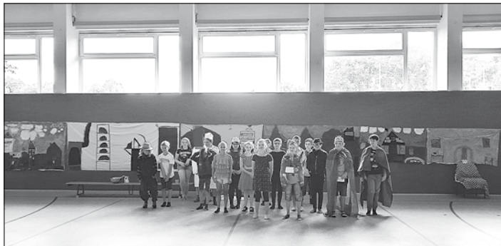
Klassenfoto in Gersdorf