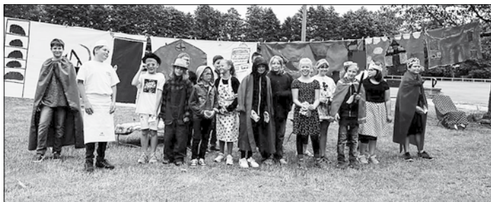
Klassenfoto in Bischheim