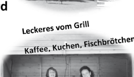
Leckeres vom Grill