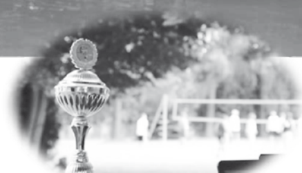
Wanderpokal der Wasserwacht

Die Wasserwacht lädt herzlich zum Badfest am 25. August 2018 ein.