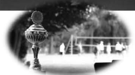
Wanderpokal der Wasserwacht

Die Wasserwacht lädt herzlich zum Badfest am 26. August 2017 ein.