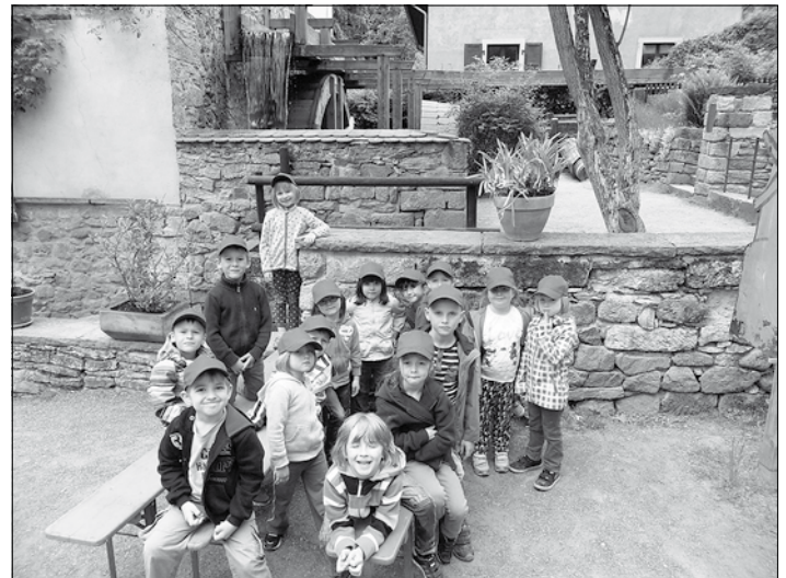
Die Vorschulmäuse bestaunen das große Wasserrad.

... genau dieses Erlebnis hatten die „Vorschulmäuse“ am 19. Mai auf ihrer Abschlussfahrt in den Zschoner Grund nach Dresden. Dort wird das Getreide in einer durch ein großes Wasserrad betriebenen Mühle zu Mehl gemahlen.