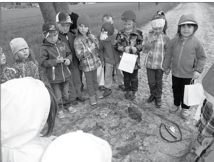
Die Vorschulmäuse und Singmäuse legen ein Bild aus den in der Natur gefundenen Materialien.

Motiviert von der Weiterbildung, die uns praktisch erfahren lies, wie wir mit und in der Natur unsere Kinder in allen Entwicklungsbereichen unterstützen können, gingen die Erzieher wieder an die Arbeit. Vieles wurde gleich ausprobiert und begeisterte Kinder sind der Lohn.