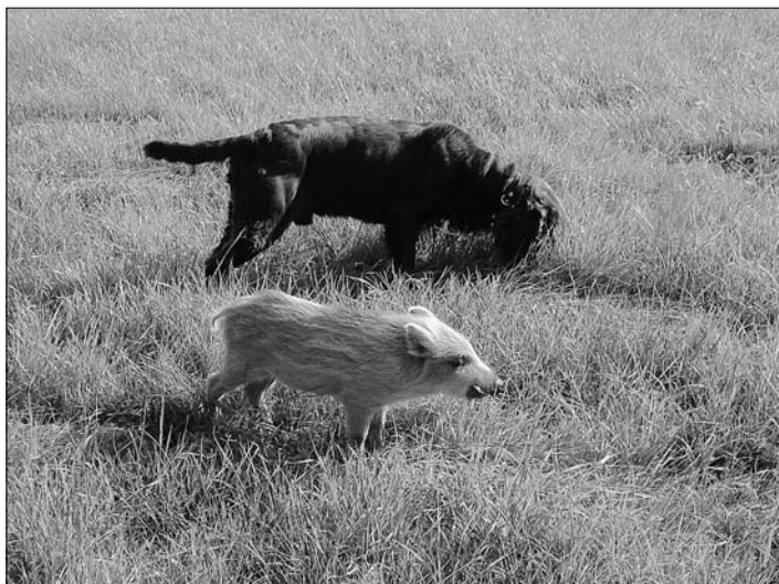
Friedliche Koexistenz bei der Jagd

der Vorstand lädt am Samstag, den 17. November 2010 um 19:00 Uhr im „Dickerchen“ in Häslich zum Jagdball ein. Dazu sind alle Wald- und Feldbesitzer sowie deren Partnerin oder Partner herzlich eingeladen. Das traditionelle Wildessen, Musik, Tanz und Tombola sowie weitere Überraschungen sind eingeplant. Pro Person ist ein Eigenanteil von 10 € vorgesehen (9 € Menue-Anteil und 1 € GEMA).