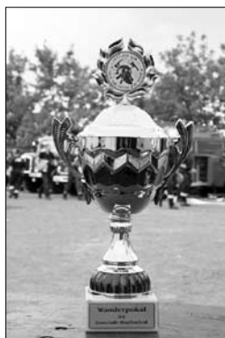
Wichtig für den Bestand unserer FF- Jugendfeuerwehren - Ein neuer Pokal hat einen neuen Sieger-

Für die Erwachsenenmannschaft von Bischheim-Häslich ging dabei ein lang ersehnter Wunsch in Erfüllung.