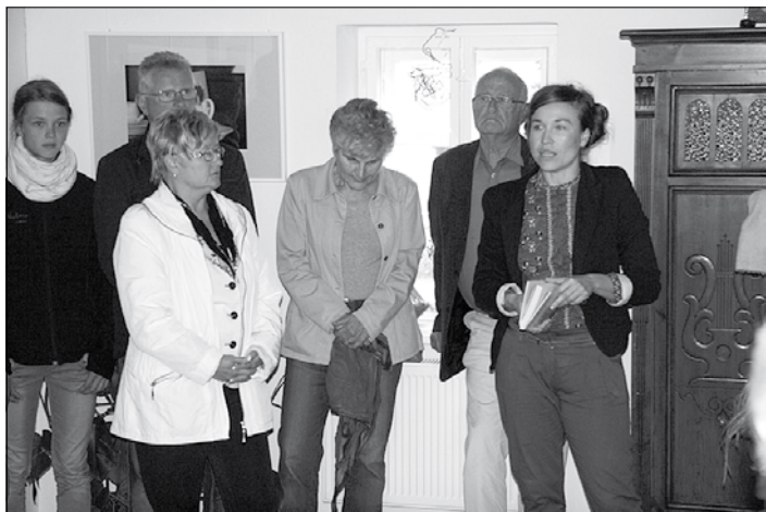
Eröffnung der Ausstellung