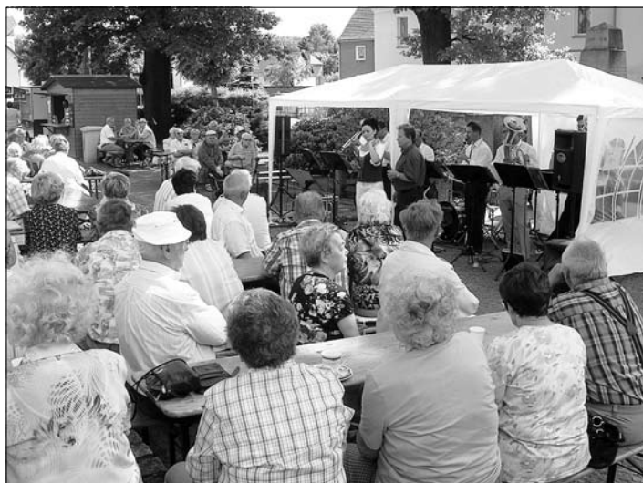
Blasmusik vor dem Karoline-Rietschel-Haus

In Möhrsdorf organisierte die Feuerwehr ein erfolgreiches kleines Ortsfest und in Gersdorf erfreute zu Pfingsten Blasmusik die Gäste vor dem Karoline-Rietschel-Haus.