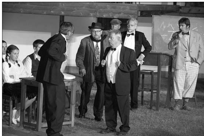
Gelungene Premiere der „Feuerzangenbowle“ auf der Naturbühne Reichenau

Ende des Monats sorgte in Reichenau die Freilichtbühne mit dem Stück „Die Feuerzangenbowle“ für einen sehr gelungenen Start in die Spielsaison.