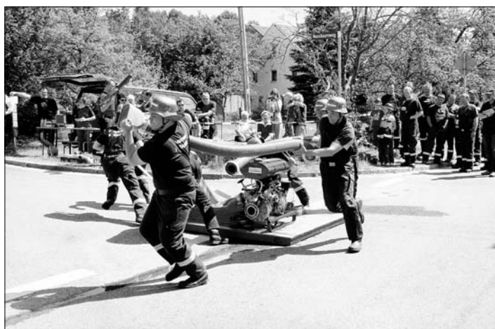
Feuerwehrfest in Möhrsdorf

Auch schöne Veranstaltungen bot unsere Gemeinde zur Freude vieler Gäste an.