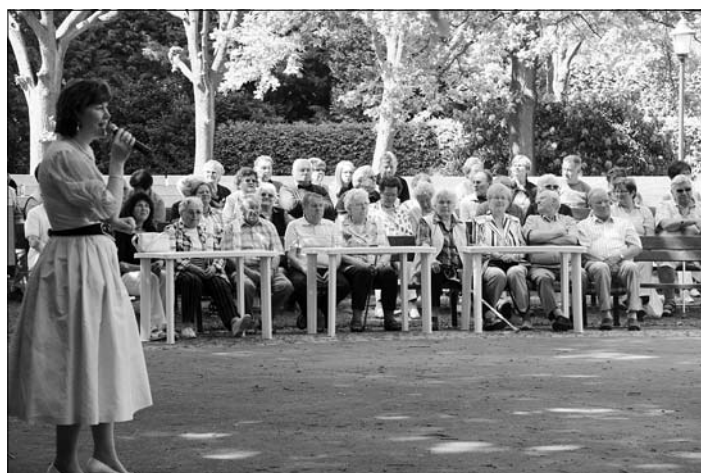
Viel los im Park Bischheim

Mit dem Tag der offenen Parks und Gärten kam wieder kulturelles Leben in diese schöne Grünanlage in Bischheim und zum 1. Mai sorgte der Vierseithof in Häslich wiederholt für ein zünftiges Frühlingsfest.